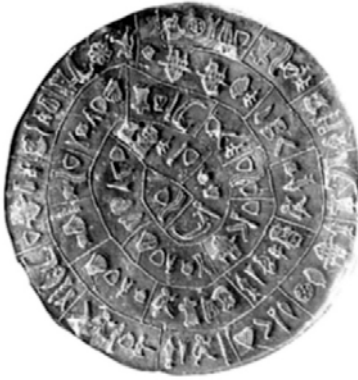
Figura 1 4 : O Disco de Festo e sua disposição espiralada / Figura 2: Tabela de caracteres da Linear A 5 .